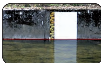
Erkennen der Wasserlinie